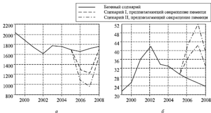
Рис. 1. Последствия сокращения помощи:

а – ВНРД на душу населения, долл. по курсу 1997 г.; б – уровень безработицы, %