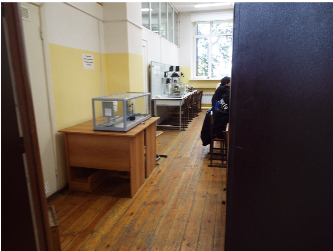
Фото Учебная аудитория