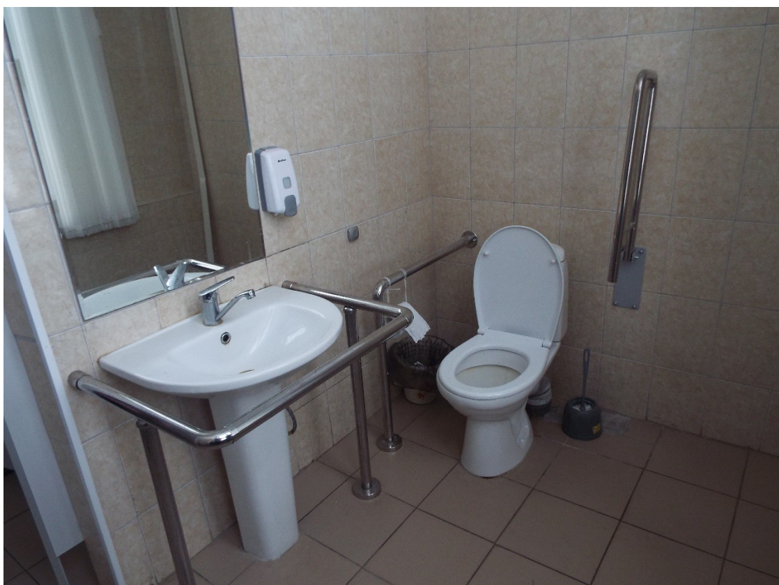
Фото Сан. узел