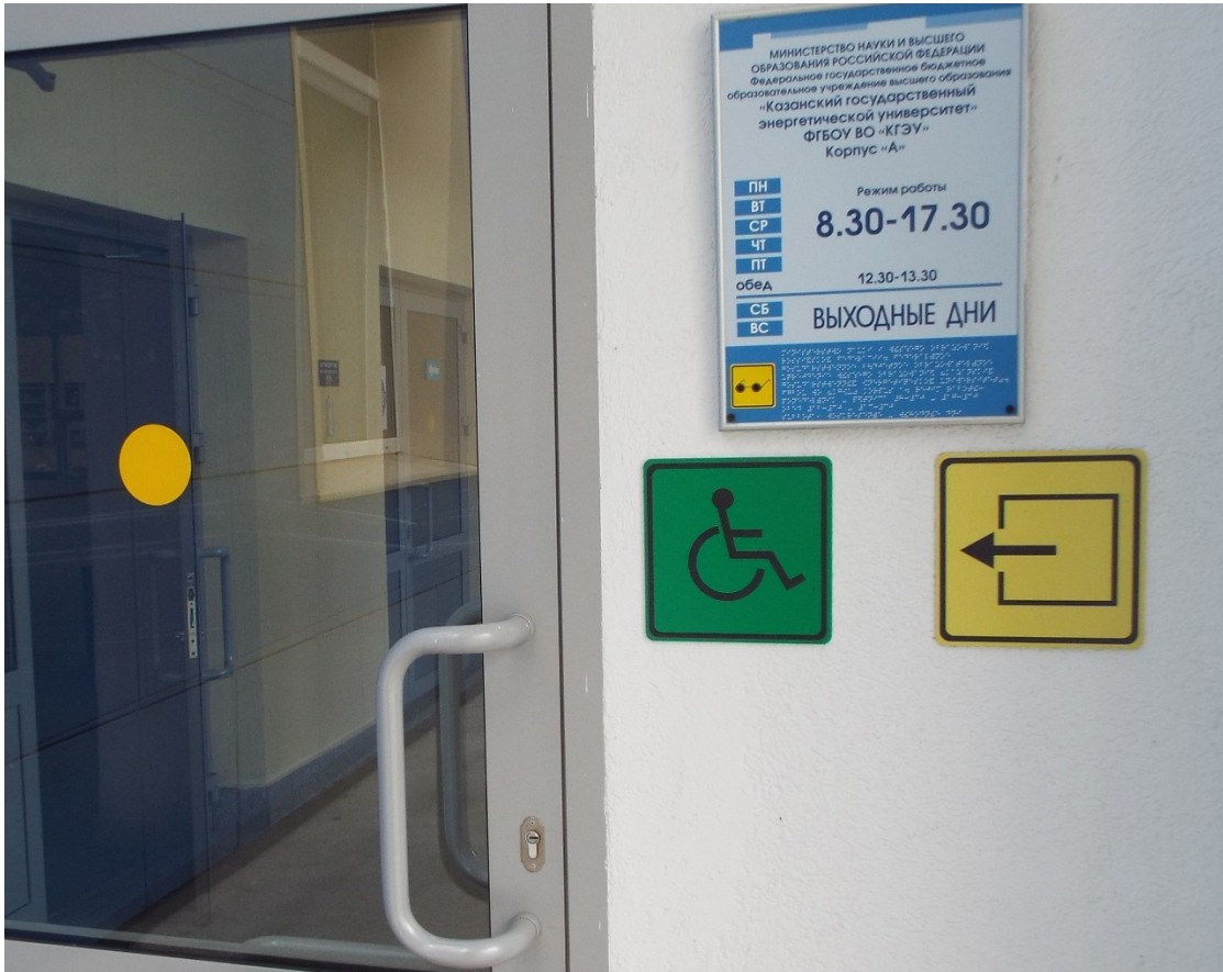
Фото Знаки на входе для МГН