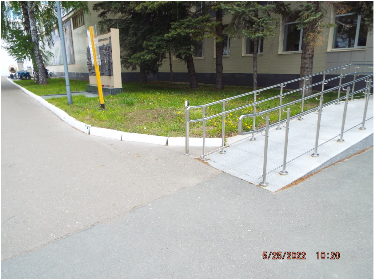
Фото Кнопка вызова персонала