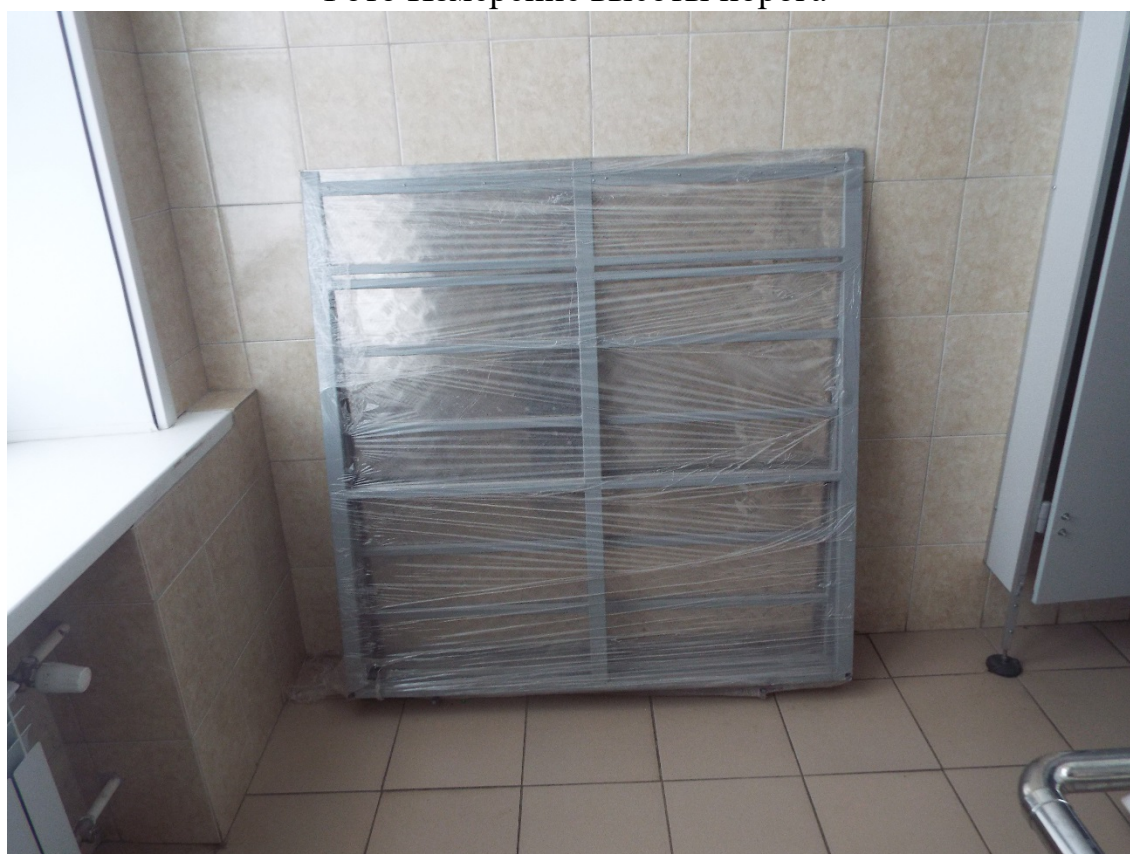
Фото Переносная эстакада