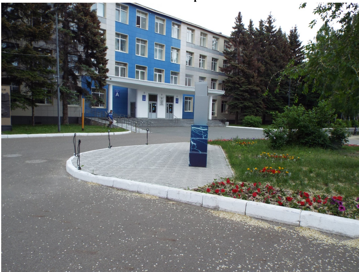
Фото Прилегающая территория