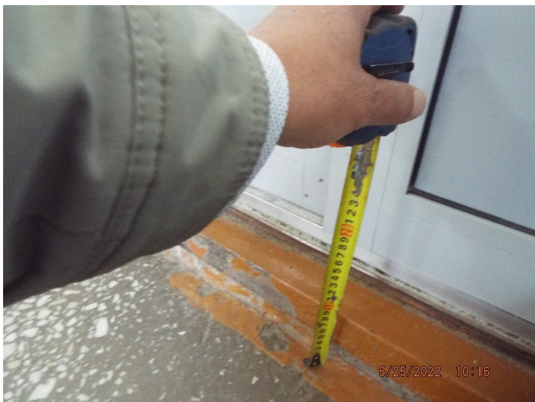
Фото Измерение высоты порога