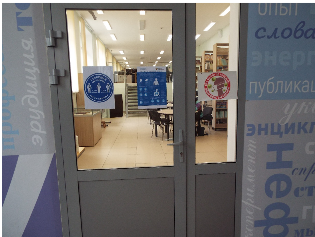
Фото Дверь в библиотеку