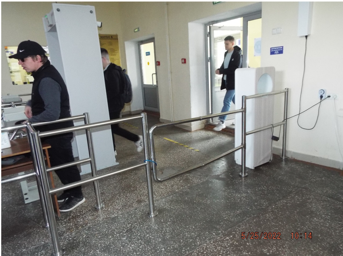
Фото Турникет для МГН