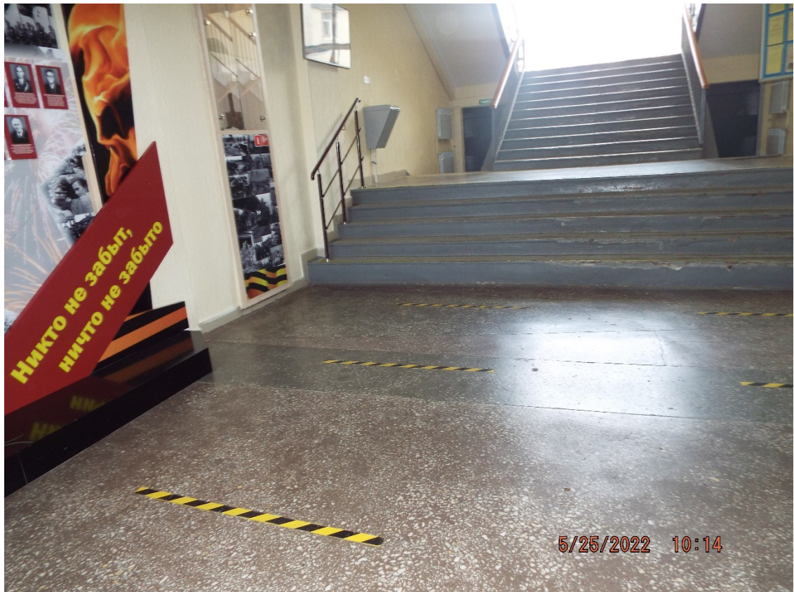
Фото Лестница на второй этаж