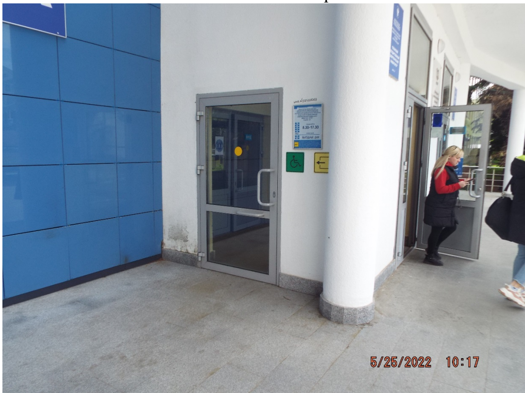
Фото Вход для МГН