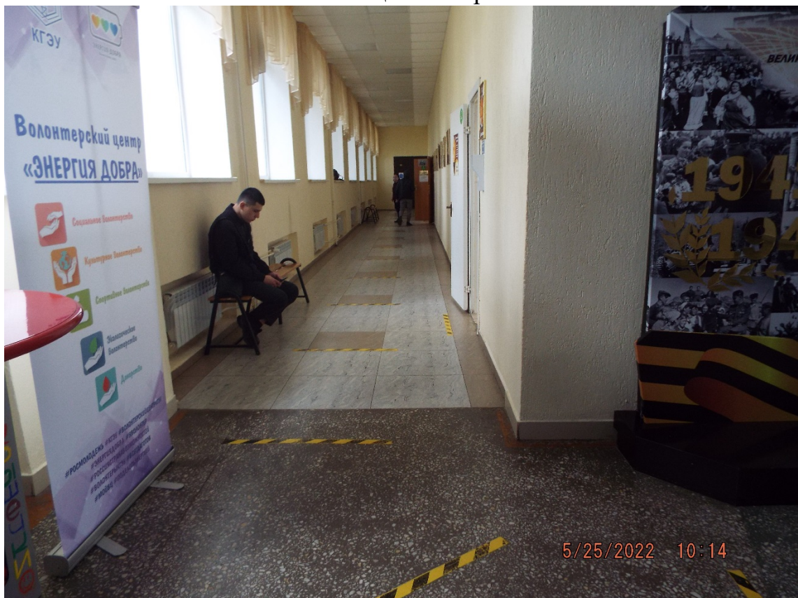
Фото Коридор корпуса А